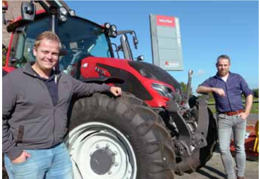
Geen ander merk dan Valtra heeft de afgelopen jaren zoveel vernieuwingen en verbeteringen doorgevoerd in z'n programma.