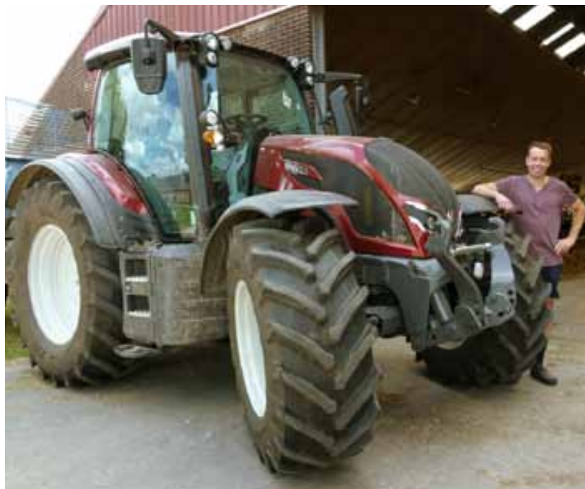
De cabine van de N serie is echt een genot. Lekker ruim en met een prima overzicht, zowel binnen als naar buiten.

“Wij hebben veel land in het Maasheggen gebied. Dat zijn kleine