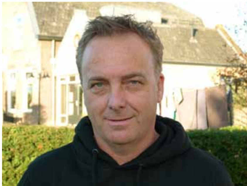
De nieuwe Valtra Q-serie biedt nu precies wat ik nodig heb in het grondverzet: een lange wielbasis, de juiste vermogensklasse en genoeg eigen gewicht.

“Maar goed, de T-serie is net iets te licht voor ons werk. De nieuwe Valtra Q-serie biedt nu precies wat