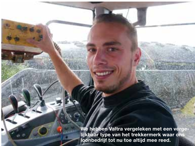
We hebben Valtra vergeleken met een vergelijkbaar type van het trekkermerk waar ons loonbedrijf tot nu toe altijd mee reed.