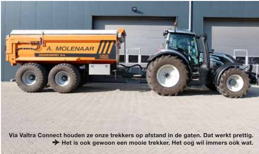
Via Valtra Connect houden ze onze trekkers op afstand in de gaten. Dat werkt prettig. ➔ Het is ook gewoon een mooie trekker. Het oog wil immers ook wat.