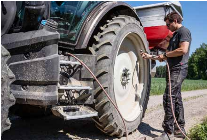
De nieuwe G-serie is leverbaar met een persluchtaansluiting aan de zijkant van de tractor bij de opstap van de cabine, waardoor het bijvoorbeeld gemakkelijk is om de bandenspanning aan te passen.

gen van Valtra. Voor bosbouwklussen kan de G-serie worden uitgerust met smalle spatborden, bosbanden, een stalen brandstoftank van 170 liter, polycarbonaatglas, een draaibare stoel en cabinebescherming die ook kan worden gebruikt om extra verlichting aan te brengen. De kenmerken van de G-serie maken de trekkers ook zeer geschikt voor werk in de openbare ruimte, bijvoorbeeld wegonderhoud. Zo is een krachtige frontheef (hefvermogen 3 ton) met frontaftakas verkrijgbaar.