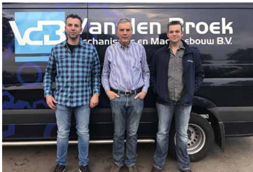
Geloof ons: uiterlijk is echt belangrijk. Als een klant een trekker niet mooi vindt, koopt hij hem niet.

De nieuwe strategie van Van den Broek Mechanisatie en Machinebouw BV heeft ertoe geleid dat