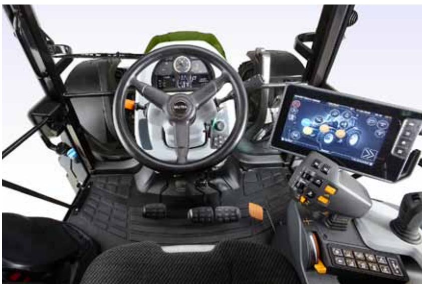
Go, Look, Drive: de nieuwe G-serie trekkers zijn zeer toegankelijk en snel en eenvoudig in gebruik te nemen. De instap is ruim, net als de cabine zelf en alle bedieningselementen zijn ergonomisch geplaatst.

De G-serie is ook leverbaar met de traditionele bosbouwvoorzienin-