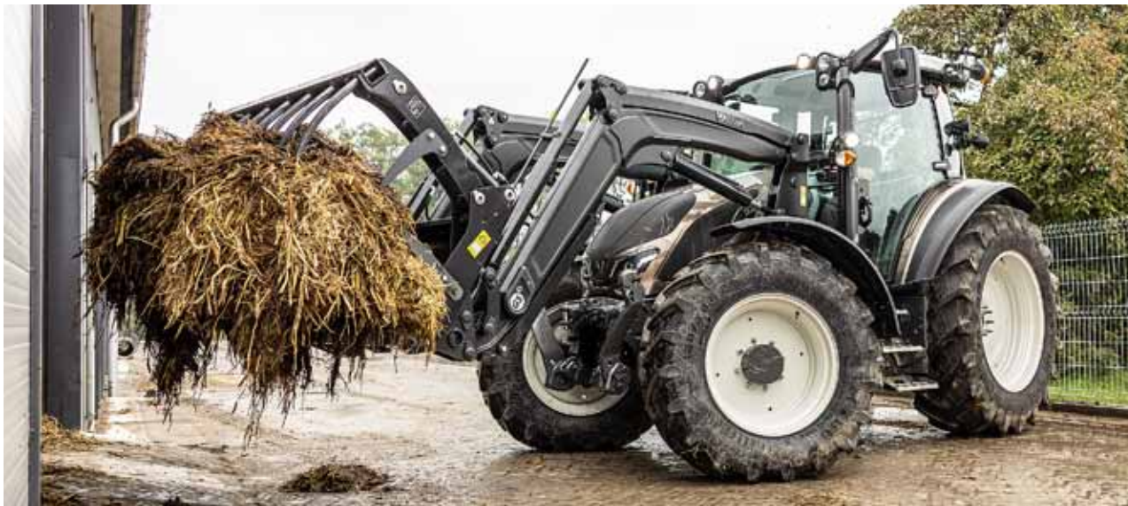
De G-serie trekkers wegen 5140 kg. Het lage gewicht, het compacte formaat en de wendbaarheid maken ze ideaal voor boerenwerk. Het maximale totaalgewicht is 9500 kg.

nog verder wil laten personaliseren kan terecht bij de Unlimited Studio.