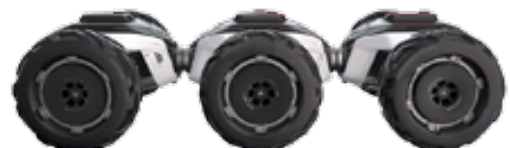
Drie assen = 300 pk