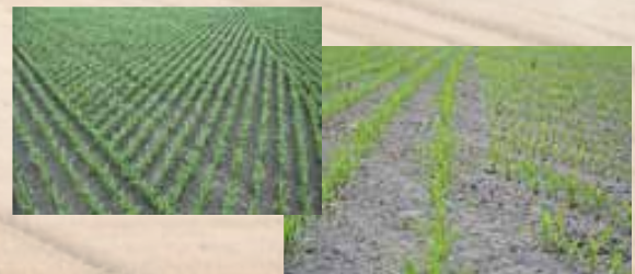
Section Control kan samen met AutoGuide worden gebruikt om percelen optimaal te benutten en zo opbrengsten te maximaliseren.