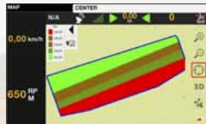
Met variabele afgifte controle (Variable Rate Control) beschikt u over een instrument voor plaats specifieke dosering van meststoffen en gewasbeschermingsmiddelen.