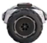
Eén as = 100 pk