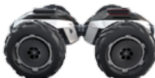
Twee assen = 200 pk