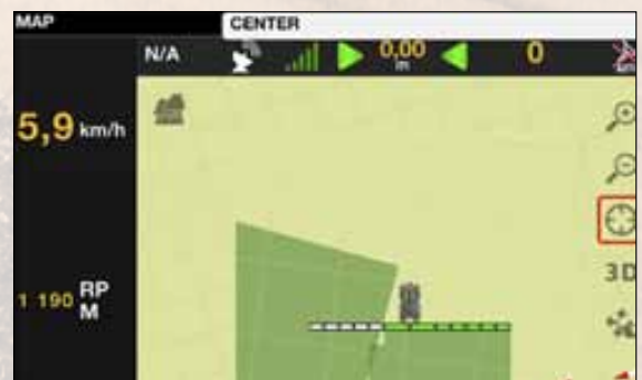
Section Control opent en sluit spuitdoppen voor het nauwkeurig bespuiten van onregelmatig gevormde percelen.

“De SmartTouch armsteun van Valtra is zeer geschikt voor de bediening van de AutoGuide- en ISOBUS-systemen dankzij het negen-inch touchscreen. Maar als een gebruiker tegelijkertijd ook andere tractorfuncties wil bewaken, is een tweede scherm wellicht een betere optie”, adviseert Mattila.