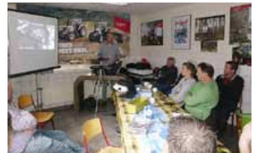
De mogelijkheden van de SmartTouch armsteun worden met een demomodel op een console uitgelegd.

huizen neemt eerst even de tijd om de armsteun goed te bestuderen. Daarna duwt hij voorzichtig maar resoluut de rijhendel naar voren. “Je rijdt er zo mee weg”, is een paar minuten later zijn conclusie. Ook Maarten de Kleine van het gelijknamige boomverzorgingsbedrijf in Heteren, ziet de SmartTouch helemaal zitten. “We zijn nu nog niet aan een nieuwe trekker toe”, zegt zijn vader, “Maar als het zo ver is, is de kans groot dat we er een SmartTouch armsteun bij bestellen. •