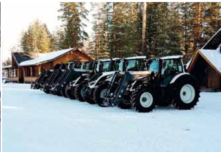
Driekwart van de deelnemers reeds tijdens de trip nog geen Valtra. De eersten zijn inmiddels 'om'.