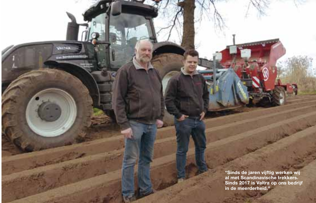
“Sinds de jaren vijftig werken wij al met Scandinavische trekkers. Sinds 2017 is Valtra op ons bedrijf in de meerderheid.”