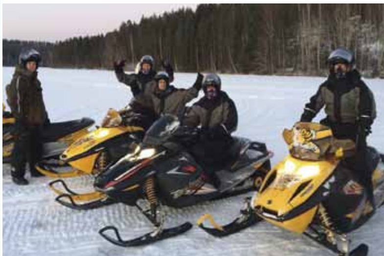
Onderdeel van het programma was een enerverende tocht met sneeuwscooters.