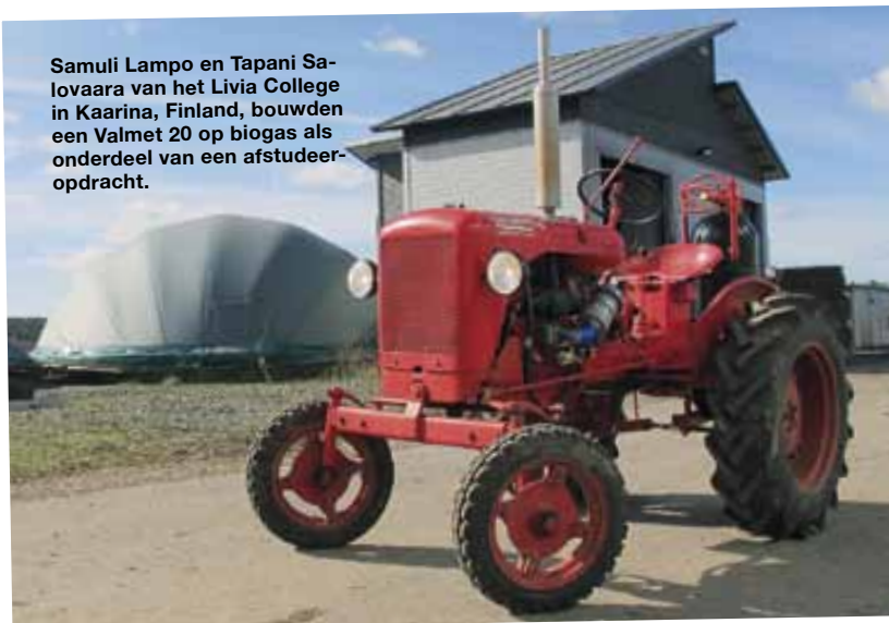
Samuli Lampo en Tapani Salovaara van het Livia College in Kaarina, Finland, bouwden een Valmet 20 op biogas als onderdeel van een afstudeeropdracht.

De makkelijkste manier om een Valmet 15 te onderscheiden van een Valmet 20 is door te kijken naar de spoorstang. Bij de Valmet 15 zit die vóór de vooras en bij de Valmet 20 achter de vooras.