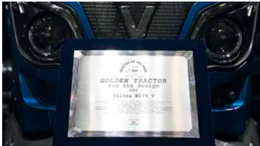
De Valtra N Serie behaalt twee prijzen op de Agritechnica: 'Machine van het Jaar 2016' en 'Golden Tractor for Design 2016.'