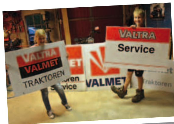
Bauke zijn kinderen zijn enthousiast geworden verzamelen mee.