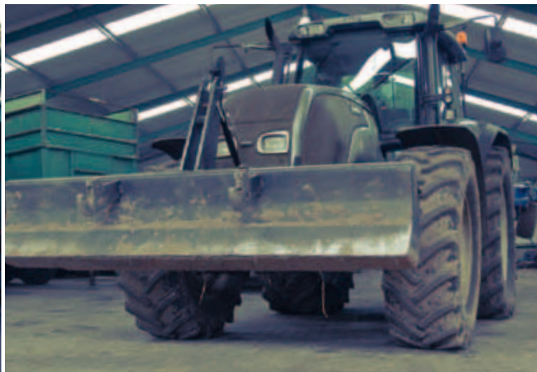
Gezamenlijk worden de zes tractoren voor een breed gamma aan werkzaamheden ingezet.