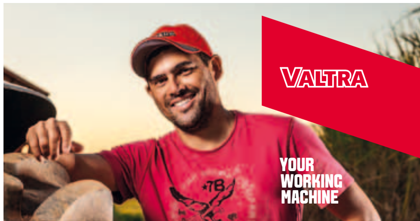
Nieuwe Valtra: duidelijk, modern, dicht bij klant.