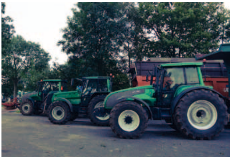
De helft van de tractoren zijn voorzien van een herkenbare groene kleur, die past bij de huisstijl van het loonbedrijf.