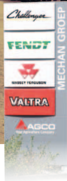
Alle AGCO merken onder één dak.