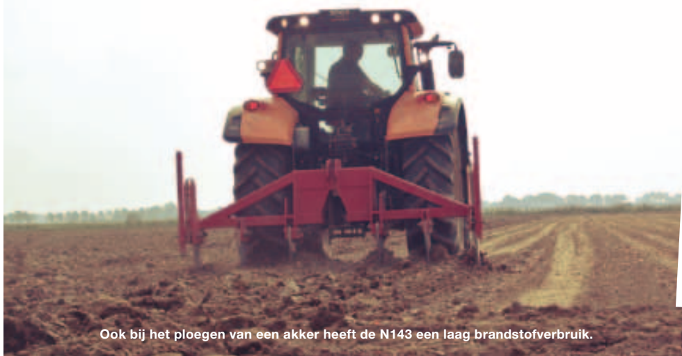
Ook bij het ploegen van een akker heeft de N143 een laag brandstofverbruik.