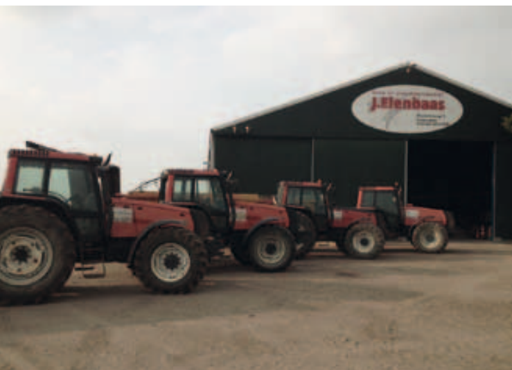
Loon- en grondwerkbedrijf J. Elenbaas, Poortvliet Loonwerk, 23007 uur.

Waar andere merken stoppen, gaat Valtra verder!